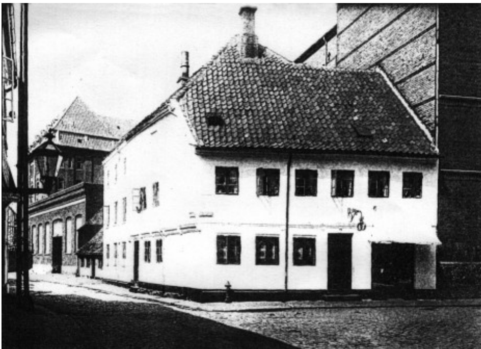
Bindingsværkshuset på hjørnet af Vestergade 66 - Vesterport I i Århus (nu nedrevet).