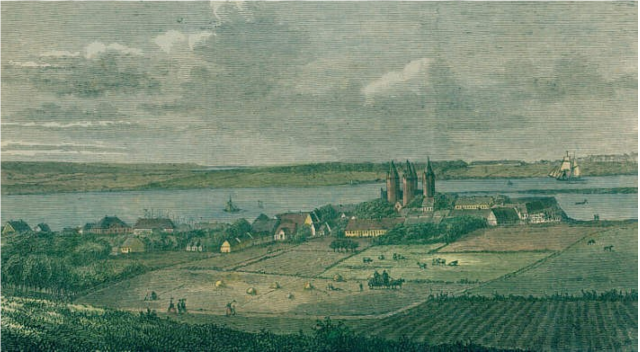
Udsigt over Kalundborg, malet af Axel Ditmer