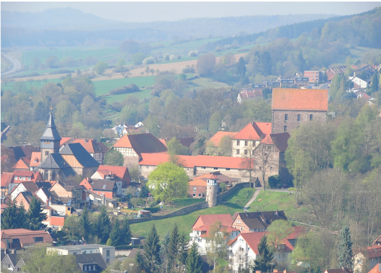
Udsigt over borgen i Hardegsen